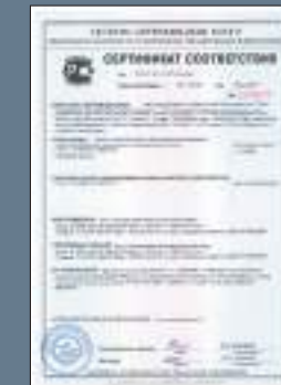
Сертификат соответствия на прокат марки SteelArt требованиям СТО 1120-48404132-004-2015