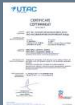
Сертификат соответствия требованиям международного стандарта ISO 9001:2008