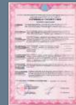
Сертификат пожарной безопасности проката марки SteelArt